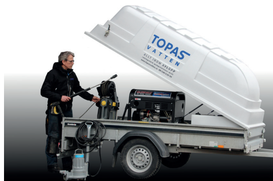
Topas Vatten servicetekniker med ett utrustat servicesläp för kostnadseffektivt underhåll med integrerat högtryck, vatten och elförsörjning.

En årlig renspolning och kontroll av pumpstationen förebygger störningar och ger en tryggare tillvaro för fastighetsägaren.