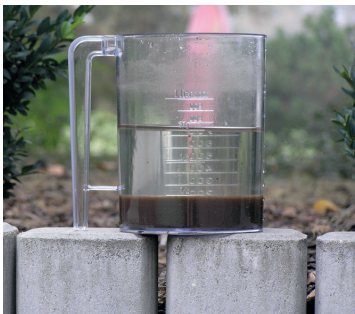
Visuell kontroll av aktivt slam i ett avloppsreningsverk. Den aktiva delen i avloppsrening.

Inom ramen för planerat underhåll utförs service av kompressorer, doseringsutrustning, filter och annat som gör att anläggningen fungerar på ett bra sätt. Pumpstationer spolas rena på slam och fettrester för att undvika luktproblem och driftstörningar.