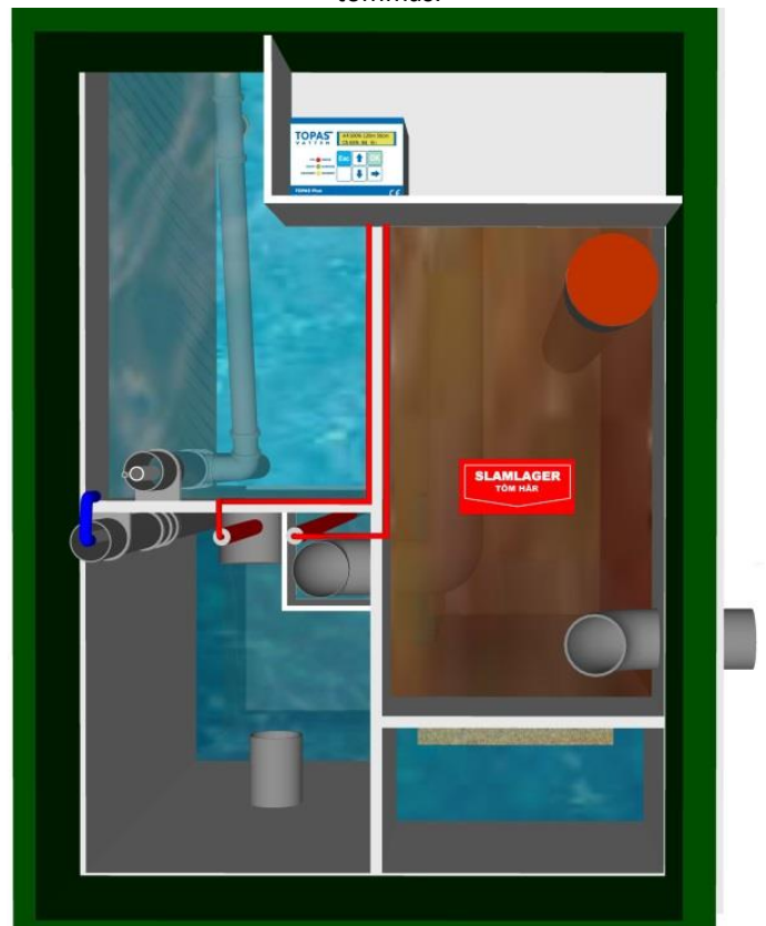
Överblick över Topas Plus 8.

Kolla efter den röda skylten märkt "Slamlager – Töm här".